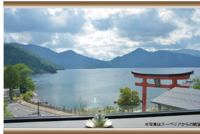
※写真はスーパーリアからの眺望