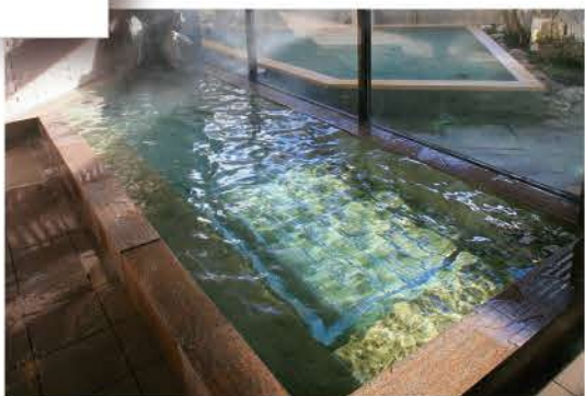
大浴場・石風呂 / 紅葉(女風呂・アルカリ性単純泉)