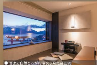
● 音楽と自然と心が行き交う月見台空間