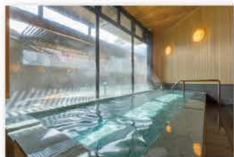
大浴場・石風呂 / 若葉(男風呂・アルカリ性単純泉)

健康増進、 疲労回復、 ストレス解消…… 優しい 『源泉かけ流し 硫黄泉の露天風呂』 お肌がすべすべ！ 『アルカリ性単純泉の大浴場』 そんな 「二つのお湯のしあわせ」を お届けします。