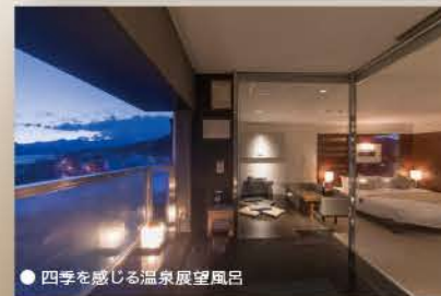
● 四季を感じる温泉展望風呂