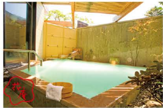
露天風呂 / 源泉かけ流し硫黄泉