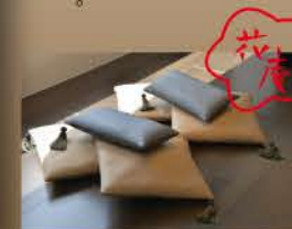
● オリジナル「花庵茶」はなのいおり

月と語るスペシヤルなお部屋 中禅寺湖の朝・夕景に包まれた月見台と展望風呂のある 特別なお部屋をご用意しております。 音楽を聴きながら月を眺めゆったり・・・ 季節の風を受けながらブライベートな温泉で想いに浸る・・・ 栃木の伝統工芸やお飲物、アメニティに至る迄心を尽くしました。 気がつくとお互いを思いやっている・・・そんなお部屋です。