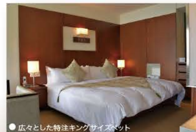
● 広々とした特注キングサイズベッド