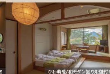
● ひわ萌葱/和モダン掘り炬燵付き