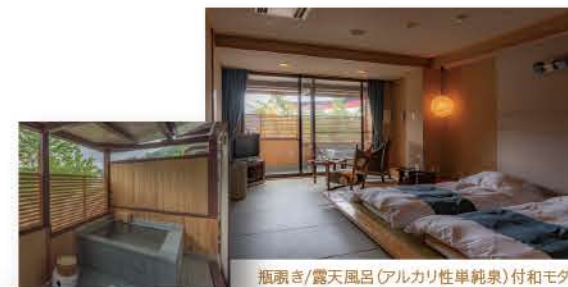
● 瓶置き/露天風呂(アルカリ性単純泉)付和モダン

日本の色名のお部屋 ゆったりとご夫婦で過ごす 「和モダンのお部屋」 ご家族やご友人との団らんの 時間が楽しい「掘り炬燵のお部屋」 気軽に便利な「洋室のお部屋」と、 ひとり一人のお客様の用途に合わせて お部屋を選んで頂けます。 また、より喜んでいただけるよう 楽しくお得なプランも季節毎に ご用意いたしております。 全二十二室、日本の色名が付けられた 潇洒なホテルです。 先人の感性に想いを馳せて頂くのも 味わいかと・・・ お客様のセカンドハウスとして おくつろぎ頂きたい、心を込めた空間です。