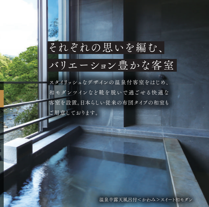
温泉半露天風呂付<かわみ>スイート和モダン

スタイリッシュなデザインの温泉付客室をはじめ、和モダンツインなど靴を脱いで過ごせる快適な客室を設置。日本らしい従来の布団タイプの和室もご用意しております。