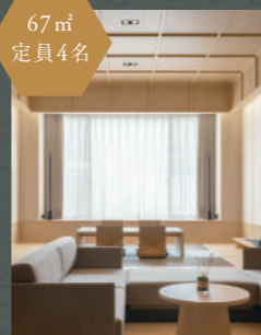
温泉半露天風呂付<かわみ> プレミアム和モダン