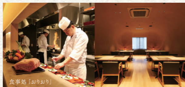
食事処「おりおり」 ※食事処は一例。お食事場所は当館の一任とさせていただきます。