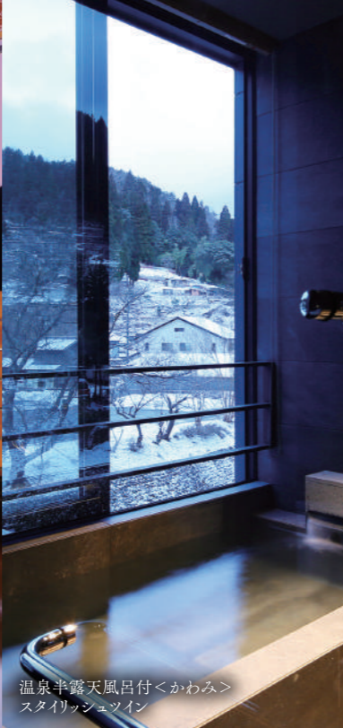
温泉半露天風呂付<かわみ> スタイリッシュツイン