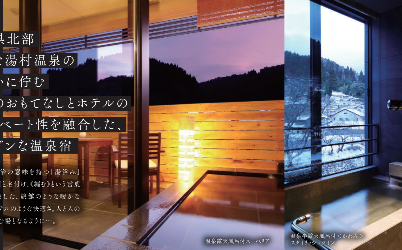
温泉露天風呂付スーベリア