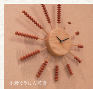
小野そろばん時計