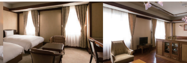
ロイヤルスイート/Royal Suite Bedroom