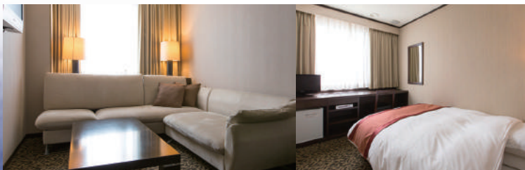
エクセートルーム/EX-EIGHT Livingroom