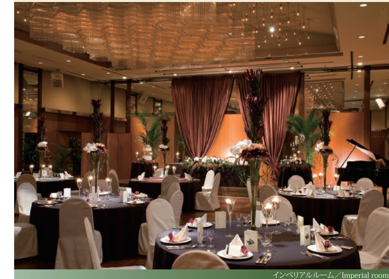
インペリアルルーム/Imperial room