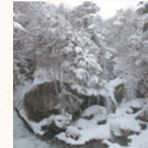
竜頭の滝 所要時間：車で約8分