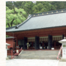
日光二荒山神社 所要時間：車で約24分