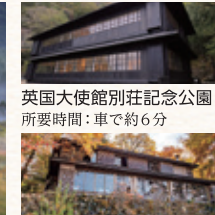
英国大使館別荘記念公園 所要時間：車で約6分