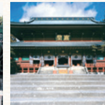
日光山輪王寺 所要時間：車で約24分