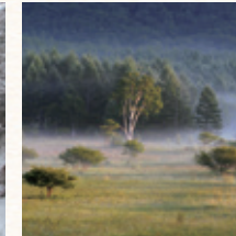
戦場ヶ原 所要時間：車で約12分