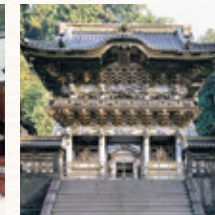
日光東照宮 所要時間：車で約25分