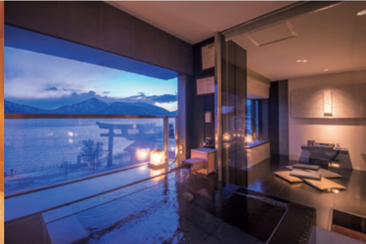
「つきみ」温泉展望風呂