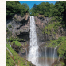
華厳の滝 所要時間：徒歩7分

中禅寺湖をはじめとする豊かな自然や歴史・文化的遺産が点在する、関東屈指の観光地日光。ホテルより日光東照宮へは車で25分、華厳の滝までは徒歩7分と、日光観光に便利な立地です。四季折々の見どころが沢山の日光をお楽しみください。