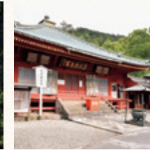
日光山 中禅寺(立木観音) 所要時間：車で約3分