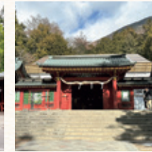
二荒山神社 中宮祠 所要時間：車で約3分