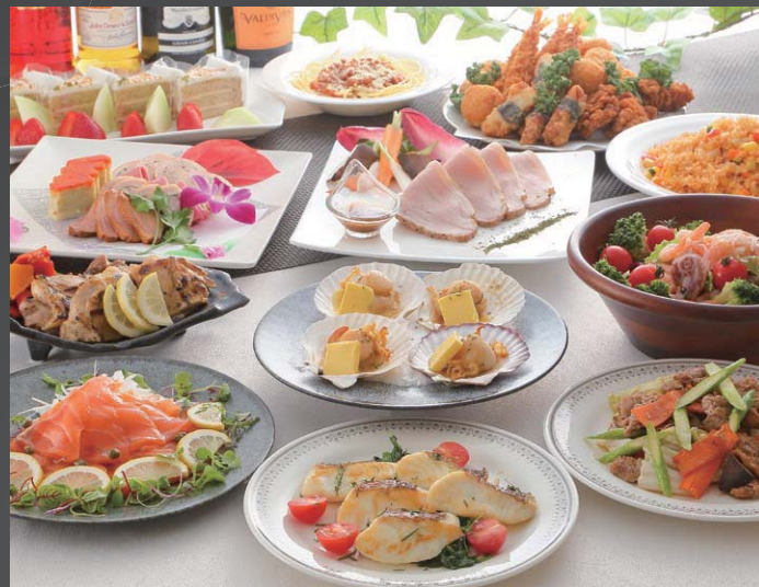
洋 ブッフェ形式(12品)