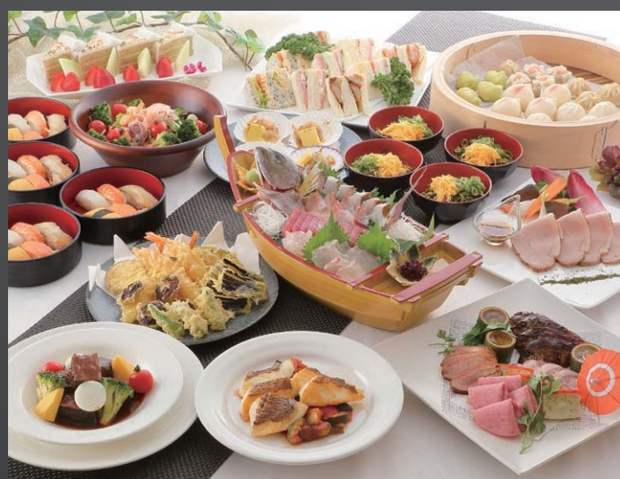
和洋 ブッフェ形式(14品)