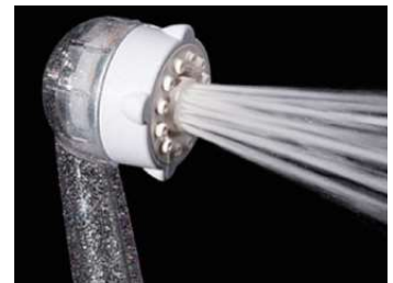
【マイクロバブルストレート水流】 ダイレクトに感じるストレート水流