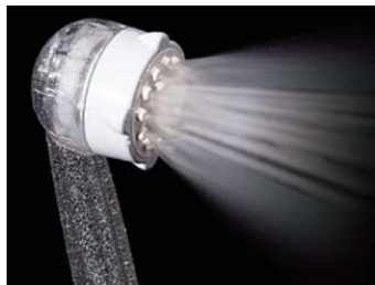
【ウルトラファインバブルミスト +マイクロバブルストレート水流】 無段階切り替えで両方の水流を同時に 使うことも可能