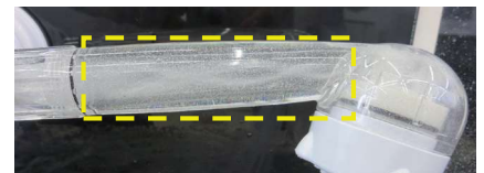
【トルネード水流可視化画像】 ※強制的に空気を送り込み流れを可視化

※計測:サイエンス調べ(マイクロトラックベル社ZETA VIEW使用) ※水質により数値は変動します。