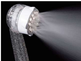
【ウルトラファインバブルミスト水流】 やさしく包み込むミスト水流

ミラブルプラスはウルトラファインバブルを含むミスト水流とマイクロバブルを含んだストレート水流をお好みのポジションでご使用いただけます。